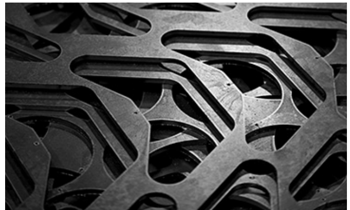
Retalhos após corte

Na Hidro-Ambiental, o aço inox é reciclado desde 2014 e até o momento já reciclamos aproximadamente 11.413 Kg.